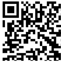
ห้องประชุม Zoom