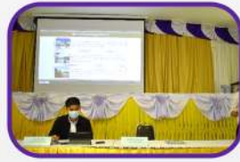
บริษัทที่ปรึกษานำเสนอ รายละเอียดโครงการ และตอบข้อซักถาม จากผู้เข้าร่วมประชุม