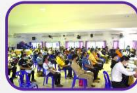
บรรยากาศการประชุม