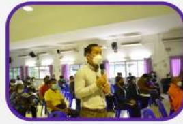
ผู้เข้าร่วมประชุมให้ข้อเสนอแนะ ต่อโครงการ