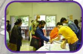
การลงทะเบียน เข้าร่วมการประชุม

กรมทางหลวงได้เล็งเห็นถึงความสำคัญของการมีส่วนร่วมของประชาชน จึงได้ดำเนินการจัดการประชุมปฐมนิเทศโครงการ (การประชุมใหญ่ครั้งที่ 1) ขึ้น เมื่อวันที่ 20 พฤษภาคม 2565 เวลา 08.30 – 12.00 น. ณ ห้องประชุมศูนย์ประสานแผนพัฒนาท้องถิ่นประจำอำเภอคนไทย จังหวัดพิษณุโลก เพื่อให้ประชาชนเกิดความเข้าใจที่ถูกต้องในการดำเนินการโครงการนี้ ตลอดจนร่วมแสดงข้อคิดเห็นและข้อเสนอแนะต่อโครงการ อันจะเป็นประโยชน์ต่อการนำไปประกอบการศึกษาให้มีความเหมาะสมและสอดคล้องกับความต้องการของประชาชนในพื้นที่ โดยได้รับเกียรติจากนายสมศักดิ์ เกี้ยวเกิด นายอำเภอคนไทย เป็นประธานกล่าวเปิดการประชุม และนายเจษฎา บุญรอด ผู้อำนวยการแขวงทางหลวงพิษณุโลกที่ 2 (วังทอง) เป็นผู้กล่าวรายงาน โดยมีผู้นำชุมชน ผู้แทนหน่วยงานเจ้าของโครงการ ผู้แทนหน่วยงานราชการ ระดับอำเภอ ผู้แทนหน่วยงานองค์กรปกครองส่วนท้องถิ่น ผู้แทนหน่วยงานรัฐวิสาหกิจ และประชาชนทั่วไปที่สนใจโครงการ เข้าร่วมการประชุมจำนวน 100 คน และผู้เข้าร่วมประชุมผ่าน Zoom จำนวน 20 คน โดยสามารถสรุปประเด็นข้อคิดเห็น และข้อเสนอแนะที่ได้รับจากการประชุม และบรรยากาศการประชุมดังนี้