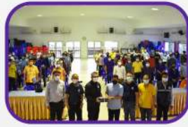
มอบของที่ระลึก